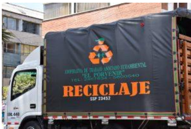
Imagen 1 Vehículo Cooperativa.